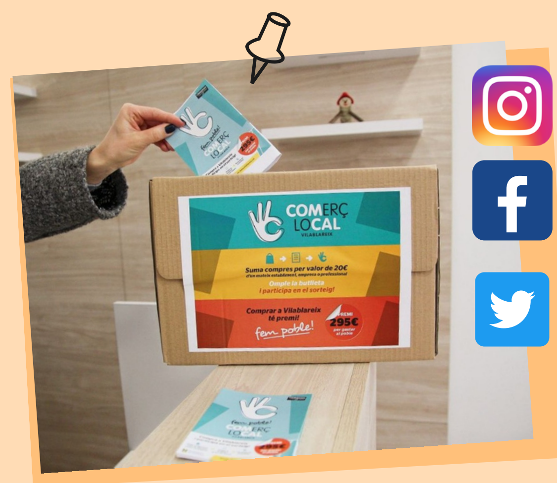
VISIBILITAT Xarxes socials